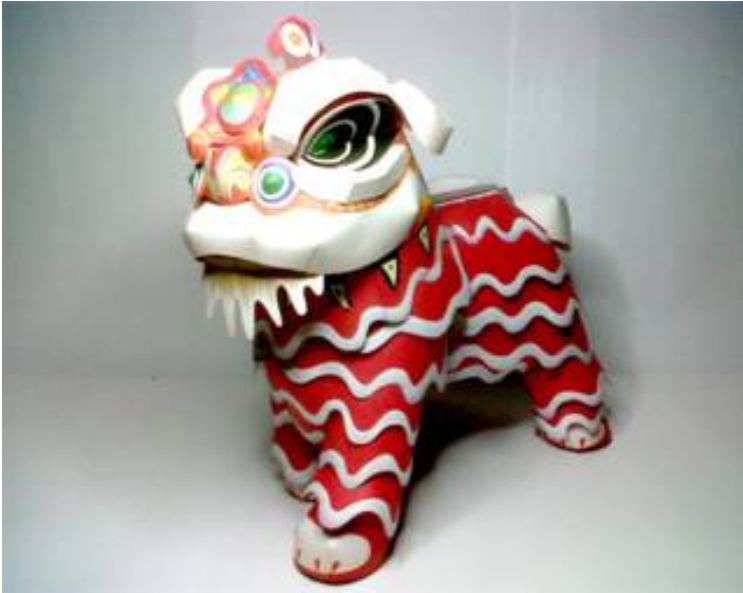
Lion Dance (ukuran : lebar 12cm, tinggi 22 cm, panjang 18 cm) ini berharga Rp. 250.000