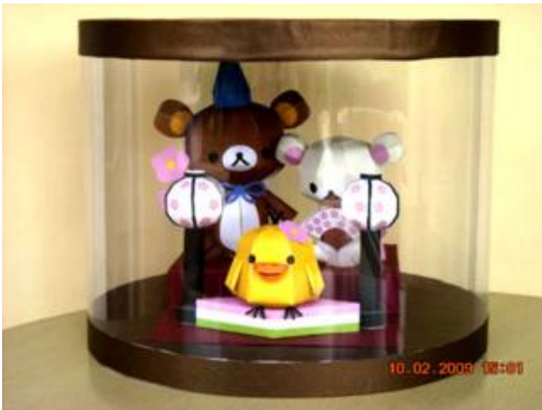
Hinamaturi Rp.165.000 (ukuran : boneka 1 : 5 cm, boneka 2 : 8 cm dan boneka 3 : 12 cm)