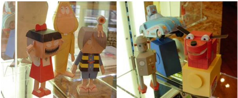
Paper Craft Modern

Berbeda dengan jaman sebelumnya, bentuk-bentuk modern Paper Craft hadir dengan warna yang sangat bervariasi, lebih detail, dengan obyek-obyek yang modern. Bahkan Paper Craft saat ini umumnya dibuat mengacu pada tokoh-tokoh kartun, komik atau tokoh olahraga populer, dsb.